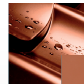
(RAL 8004) šviesi plytinė