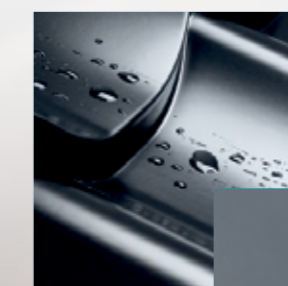
(RAL 7024) grafito pilkumo